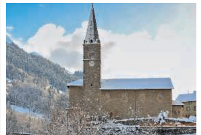
Die Kirche in Troistorrents wurde 1722 erbaut. Nun müssen Mauern und Gewölbe saniert werden.

Die Pfarrkirche San Martino in Prato-Sornico (TI) ist eine romanische Kirche mit barocker Innenausstattung von historischer Bedeutung. Die Statuen und Fresken im Innen- und Aussenbereich sowie die Hauptfassade befinden sich in einem Stadium des Verfalls und müssen dringend saniert werden.