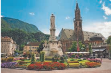
Waltherplatz mit Dom Maria Himmelfahrt, Bozen.