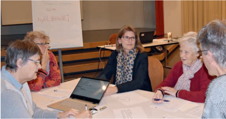
Eine Fünfergruppe aus Luzern diskutiert die Fragen des Bistums.