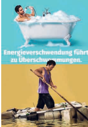
Das provokative Kampagnensujet soll Denkanstösse geben.

Darüber hinaus soll drittens auch die soziale Dimension beachtet werden.