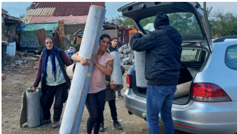
Dankbar nehmen Bewohnerinnen und Bewohner einer slumähnlichen Siedlung die wärmenden Vliesmatten entgegen.

Egal ob Süssigkeiten oder Grundversorgung: Die Weihnachtsgeschenke haben Freude gemacht! Bei den Verantwortlichen von «Cadou» trafen während der letzten Wochen entsprechende Rückmeldungen ein. Allen Spenderinnen und Spendern darf aus Rumänien «Multumesc mult!» weitergeleitet werden. Ein herzliches Dankeschön!