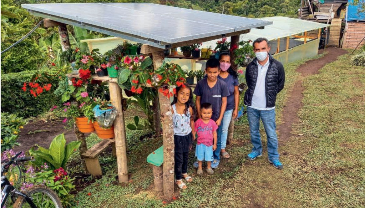
In Tolima (Kolumbien) fördert die Fastenaktion möglichst nachhaltige Energie, wie die Solarpanels zeigen.