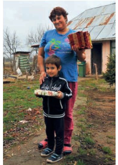
Wie dieser Junge bei einer früheren Päckli-Aktion haben sich auch dieses Jahr viele Kinder freuen dürfen.

Die Partner von «Cadou» bestätigen, dass es vielen Haushalten am Nötigsten fehlt. Grund dafür ist auch die Pandemie. Sie erschwert es vielen Erwachsenen, saisonal im Ausland zu arbeiten und so das Auskommen ihrer Angehörigen zu sichern.